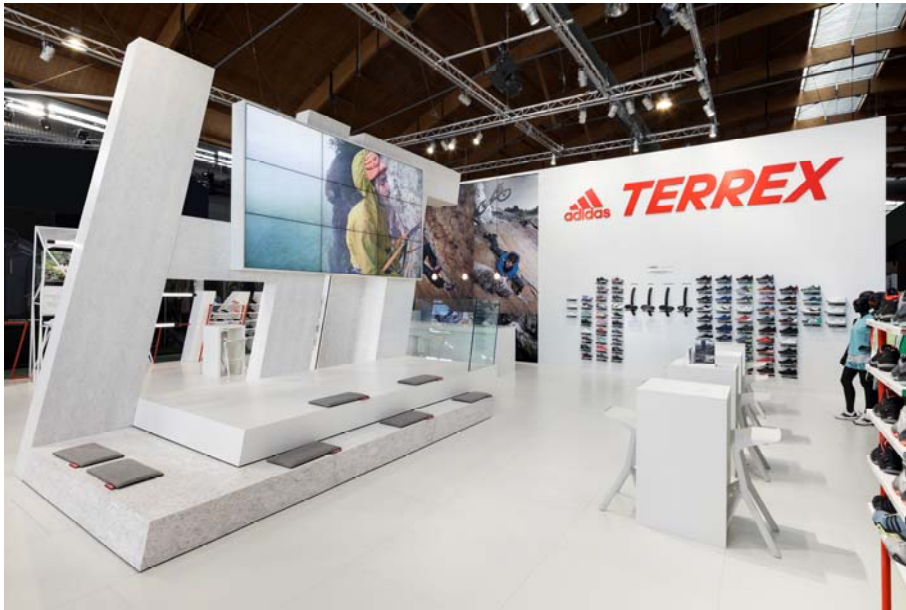
IMG_0691: Dart entwickelt das Messedesign für adidas TERREX weiter, u.a. mit einem DJ Pult und einer Bühne plus großformatigem Screen.