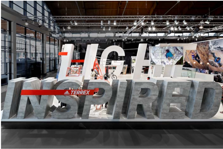
IMG_0616: Zum dritten Mal verschafft die D'art Design Gruppe adidas TERREX einen starken Markenauftritt auf der Outdoor 2017.