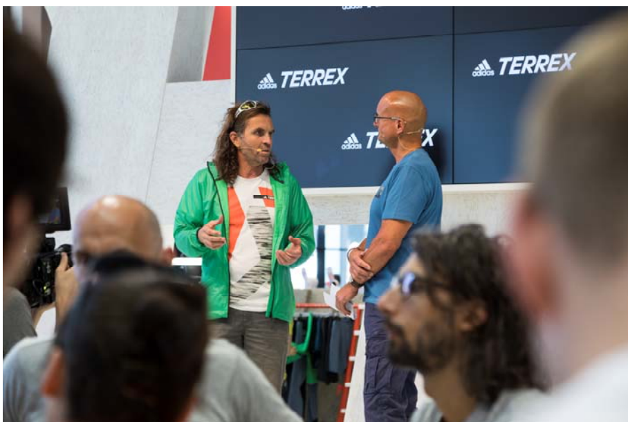
IMG_0463: Interviews mit Größen aus der Outdoor-Szene wie Thomas Huber bieten der Community zusätzliche Aktionen.